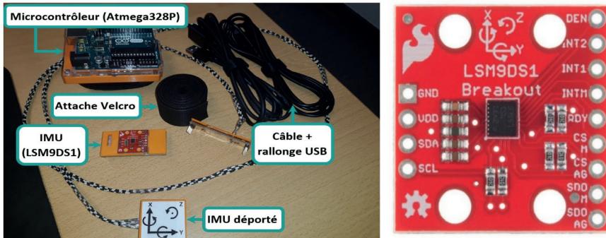
Figure n°1. Appareillage complet avec capteur inertiel (à gauche) et agrandissement du capteur inertiel LSM9DS1SparkFun (à droite).

données cinématiques des participants. Ce capteur a été développé par le Ce-REF Technique dans le cadre du projet FIRST HE DYSKIMOT 2 (fig. n°1). Il a été validé par de nombreux tests en laboratoire (Estievenart, 2018). Pendant l'expérimentation, le capteur inertiel est fixé dans la région lombaire du sujet, en regard de la quatrième vertèbre lombaire et il va permettre de mesurer les vitesses angulaires, \vec{\omega}(t) , et les accélérations linéaires, \vec{a}(t) , dans les 3 dimensions. La fréquence d'acquisition du capteur est de 100 Hz avec une gamme d'accélération de \pm 4[g] et de \pm 2000^\circ/s pour la vitesse angulaire. Entre T1 et T2, il a été demandé à toutes les équipes soignantes de recenser les chutes des participants. Ce relevé de chutes servira par la suite à classer les sujets en « non-chuteurs » (absence de chute) et « chuteurs ». Au final, on dénombre 23 chuteurs et 50 non-chuteurs. En T2, le même protocole a été réalisé sur les participants.